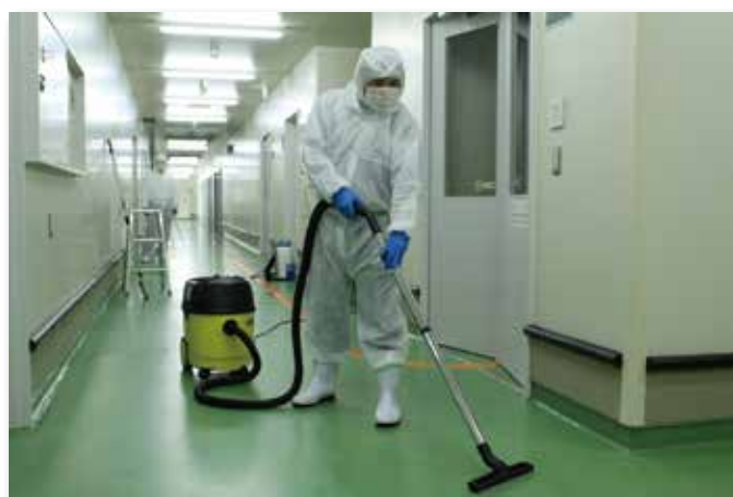
●乾湿両用掃除機による薬液回収