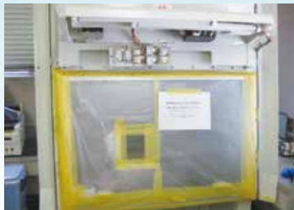
●バイオハザード対策用キャビネット

新規施設への引っ越しに伴う（インキュベータや飼育ラック等の大きい機器から小さい機器まで）除染・無菌化も承ります。