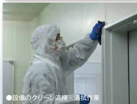
●設備のクリーン清掃・清拭作業