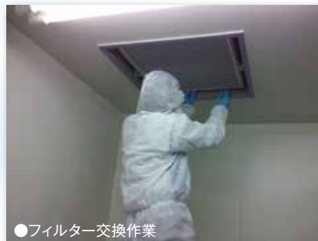
●フィルター交換作業