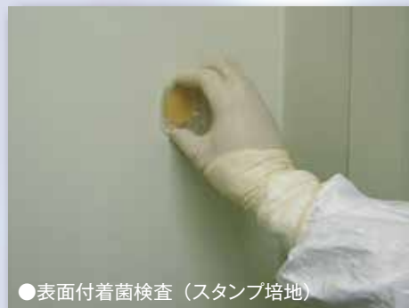
●表面付着菌検査（スタンプ培地）