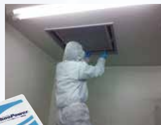
HEPAフィルター交換風景

HEPA等各種フィルターの 販売・交換。 クリーン清掃資材の販売。 クリーンルーム等の メンテナンス。