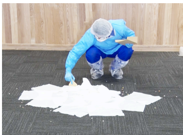
吐瀉物除去の様子