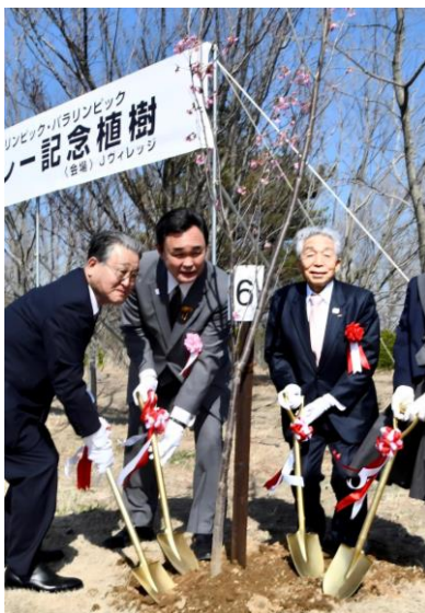
2021年福島ジェイビレッジでの記念植樹