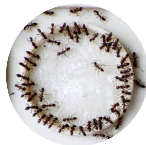
ハイドロジェルに群がるアリ