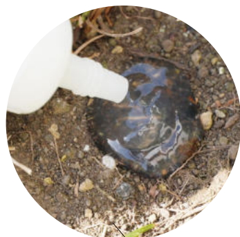
生分解性があるので土壌に直接処理できる

本剤は生分解性であり、自然環境の中で時間とともに分解される性質を持っています。 そのため、使用後に薬剤が環境中へ残留しにくく、動植物や土壌への影響を最小限に抑えることができます。 さらに、従来の液剤やスプレー剤と比較して薬剤使用量を大幅に削減できるため、 環境負荷の低減だけでなく、「必要以上に薬剤を撒かない」という安心感にもつながります。 エコと効率を両立した薬剤です。